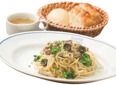
日替わりパスタ 880(税込) Today's Pasta [本日のパスタ+スープ+パン] 本日のおすすめ食材をつかった パスタランチ!