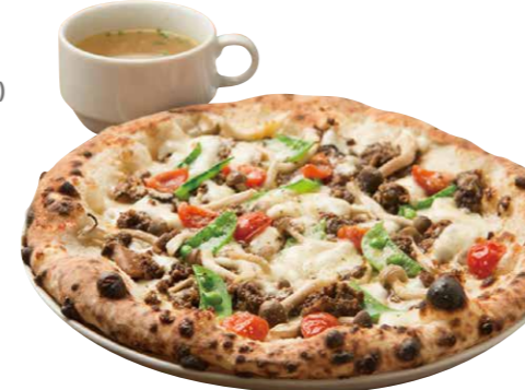
本日のPIZZA 930(税込) Today's Pizza [本日のPIZZA+スープ]