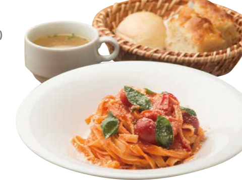
週替わりパスタランチ 980(税込) Weekly Pasta [今週のパスタ+スープ+パン]