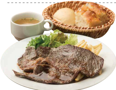
ステーキランチ 1000(税込) Steak Lunch [牛肩ロースステーキ+スープ+ライスorパン] 肉々しいガッツリステーキ150g!