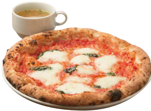
PIZZAマルゲリータ 880(税込) Pizza Margherita [PIZZAマルゲリータ+スープ] モッツァレラ・バジル・トマトの ナポリPIZZAの定番!