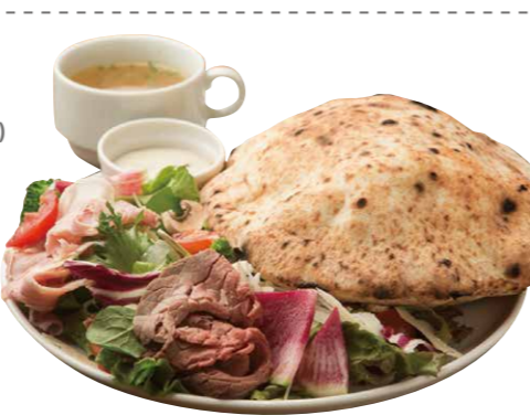
ベジプレート 950(税込) Vege Plate [ベジプレート+スープ] たっぷり野菜にローストビーフ。 焼きたてフォカッチャと!