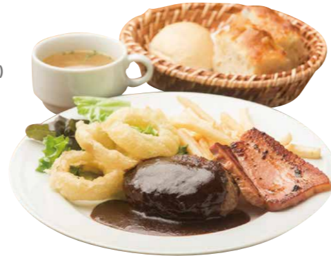
ハンバーグランチ 930(税込) Hamburger Steak Lunch [本日のハンバーグ+スープ+ライスorパン]