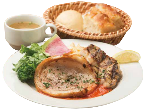
本日のランチ 880(税込) Today's Lunch [本日のメイン2種+スープ+ライスorパン] 毎日変わるボリュームたっぷり! メインが2種のおすすめランチ!

パン・ライスはおかわり自由です。お気軽にお申し付けください。*写真は一例です。メニューにより日替わりまたは週替わりで内容が変わります。詳しくはスタッフまで!