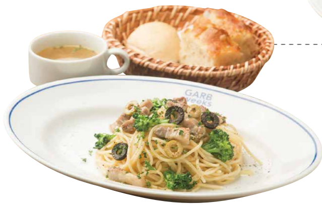
ホリデーパスタランチ 950(税込) Holiday's Pasta [休日のパスタ+スープ+パン]